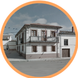
AYUNTAMIENTO DE VILLAHERREROS