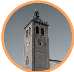
IGLESIA DE SAN ROMÁN