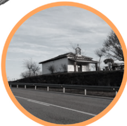
ERMITA DE SAN MILLÁN