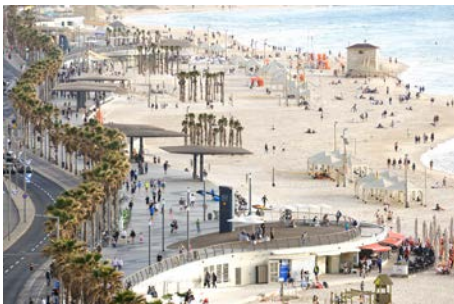
Remodelación del paseo marítimo de Tel Aviv Tel Aviv (Israel) Mayslits Kassif Architects

https://landscape.coac.net/remodelacion-del-paseo-maritimo-de-tel-aviv