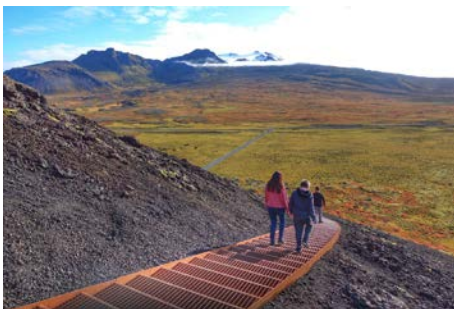
Escalera del cráter Saxhóll Reykjavík (Islandia) Landslag ehf

https://landscape.coac.net/parque-lineal-ferrocarril-de-cuernavaca