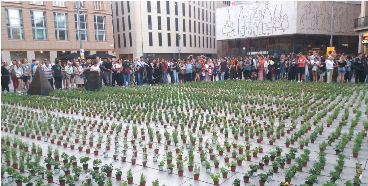
Imagen de la acción POP UP GREEN 2016

https://landscape.coac.net/sites/default/files/MANIFIESTO_CAST.pdf