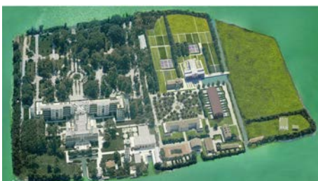
Espacios abiertos y proyecto del parque histórico de Sacca Sessola Venècia (Italia) CZ Studio associati

https://landscape.coac.net/remodelacion-del-paseo-maritimo-de-tel-aviv