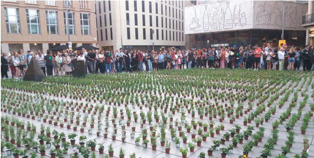
Imatge de l'acció POP UP GREEN 2016

https://landscape.coac.net/sites/default/files/MANIFIESTO_CAT.pdf