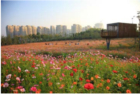
Performative and Transformative: Quzhou Luming Park Beijing (Xina) Turenscape

https://landscape.coac.net/new-turenscape-project